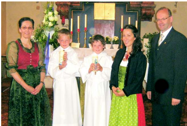
Umrahmt von den Lehrpersonen und dem Pfarrer