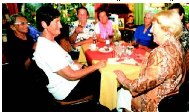
...und für die Zusage, dass wir wiederkommen dürfen!