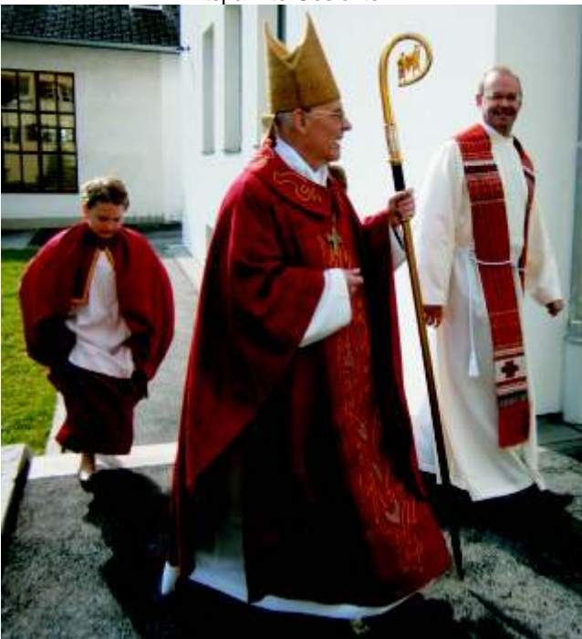
...ein beherzter Schritt...