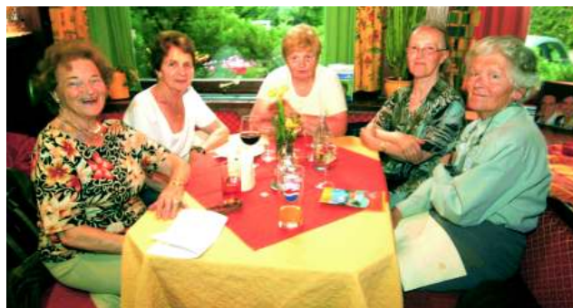
...für den vollmundigen Wein und die Schmankerln...