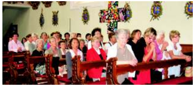
Jeder konnte seine persönlichen Gedanken...