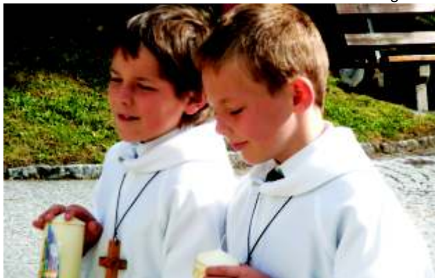
„latz ham mir ins a Jause verdient!“