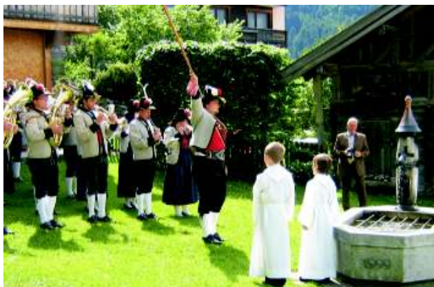
Die Musik rückte für Erstkommunikanten und Firmlinge aus