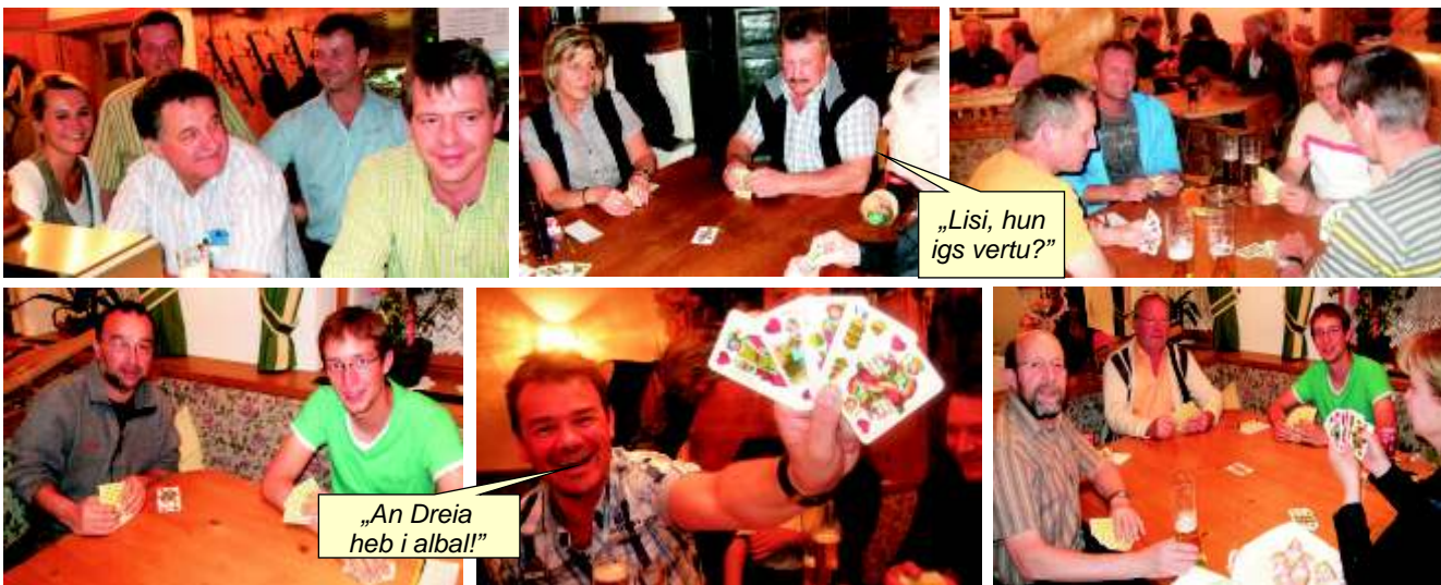
„Lisi, hun igs vertu?“