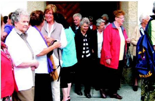
Nach der geistigen Stärkung freuten wir uns auf den Kaffee