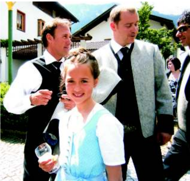
...eine wohlverdiente Stärkung...