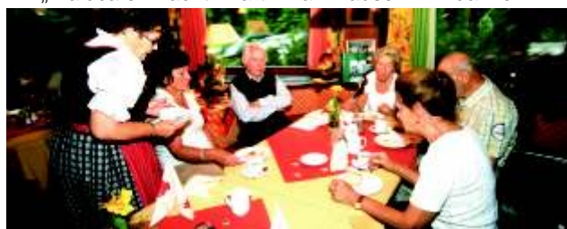
...dir tausendmal für den herrlichen Kaffee...