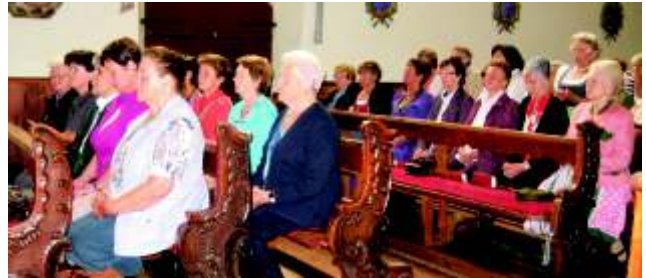
...Anliegen, Bitten und Dank...