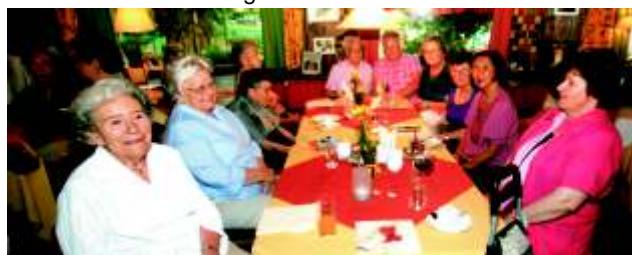
...deine netten Worte und für die gute Unterhaltung...