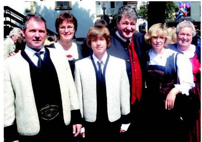
...und Aufbruch zur Familienfeier.