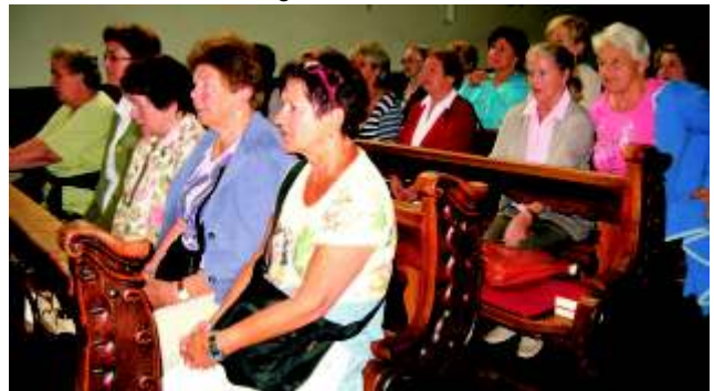
...vor unseren Herrn bringen.