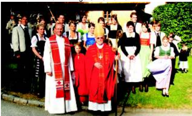
Versammelte Firmlinge mit Paten und Abt Anselm

Neun junge Leute aus der Pfarrgemeinde Brandberg sind seit dem Fest der Heiligen Firmung besonders ausgerüstet mit der Kraft des Heiligen Geistes.